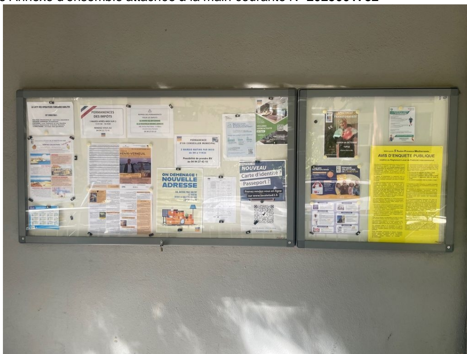
Photo N° 4 Mairie Annexe vue rapprochée attachée à la main courante N° 2025001782