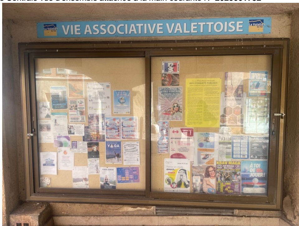
Photo N° 2 Mairie Centrale vue rapprochée attachée à la main courante N° 2025001782